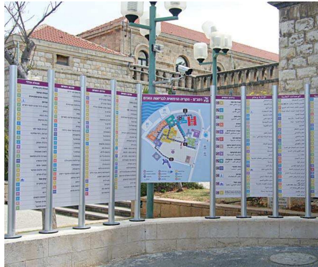
שילוט הכוונה בכניסה הראשית לבית החולים רמב"ם בחיפה.