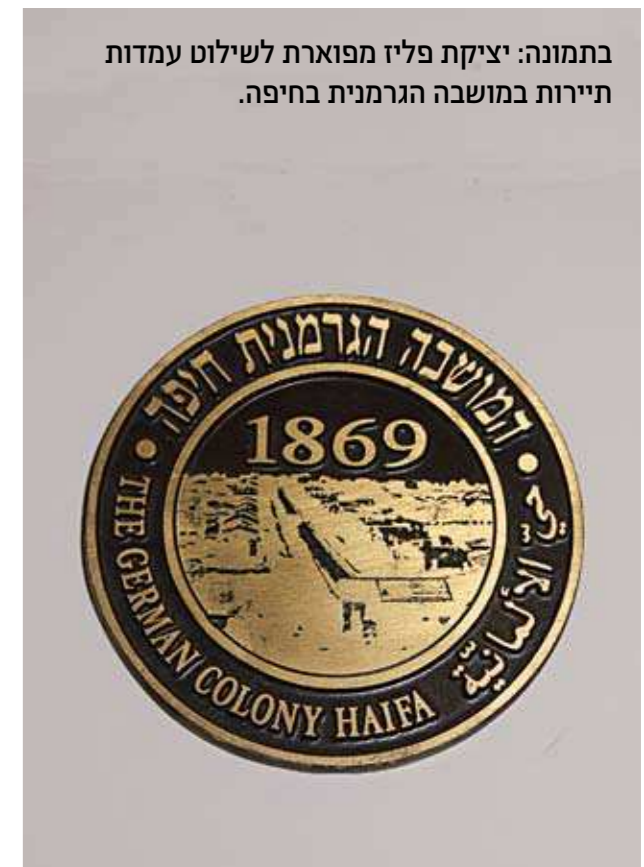
בתמונה: יציקת פלזמה מפוארת לשילוט עמדות תיירות במושב הגרמנית בחיפה.

כרסום ממוחשב ומדויק של חומרים שונים לתע"י שייה הכבדה הותיקה, יציקות פלדה ומתכות וכרסום בהיקפי ענק תוך שימוש בטכנולוגיות עיצוב יצירתיות כגון התזת חול ממוקדת.