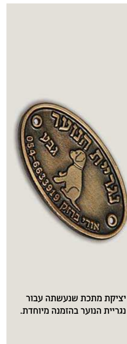
יציקת מתכת שנעשתה עבור נגריית הנוער בהזמנה מיוחדת.