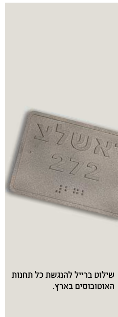
שילוט ברייל להנגשת כל תחנות האוטובוסים בארץ.