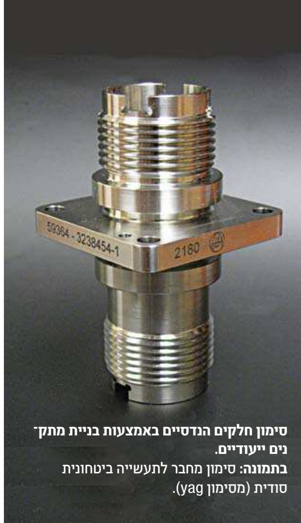
סימון חלקים הנדסיים באמצעות בניית מתקן נים ייעודיים. בתמונה: סימון מחבר לתעשייה ביטחונית סודית (מסימון yag).