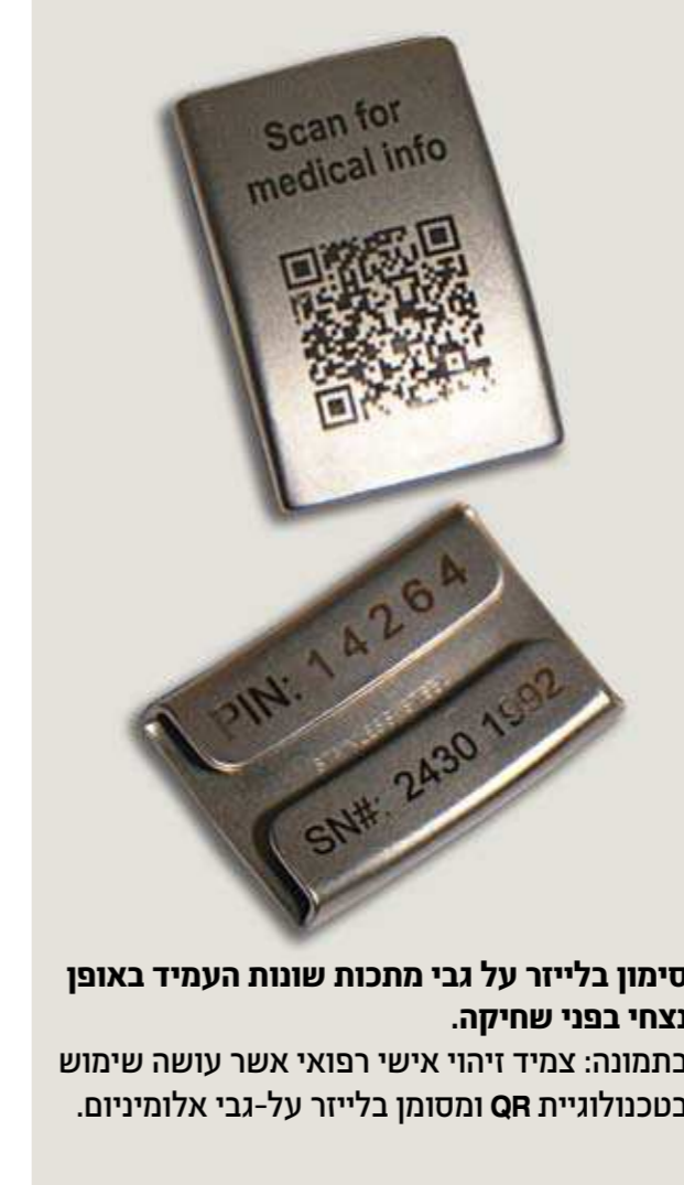
סימון בלייזר על גבי מתכות שונות העמיד באופן נרחב בפני שחיקה. בתמונה: צמיד זיהוי אישי רפואי אשר עושה שימוש בטכנולוגיית QR ומסומן בלייזר על-גבי אלומיניום.