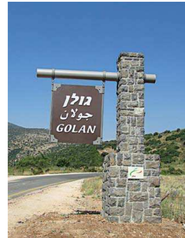
שערי רמת הגולן, בכניסה לכל אחד מששת הכבישים המובילים לרמת הגולן.

תכנון, ייצור והרכבה של שלטים ממגוון חומרים הנוצרים משרטוטים ורעיונות, תוך שיתוף פעולה מלא עם הלקוח והיכרות מעמיקה עם צרכיו.