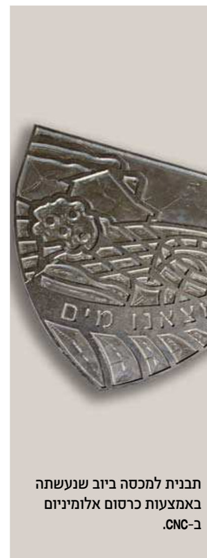
תבנית למכסה ביוב שנעשתה באמצעות כרסום אלומיניום CNC-ב.