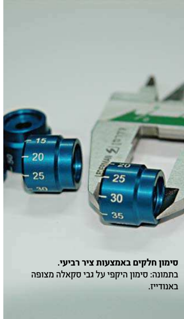
סימון חלקים באמצעות ציר רביעי. בתמונה: סימון היקפי על גבי סקאלה מצופה באנודיז.