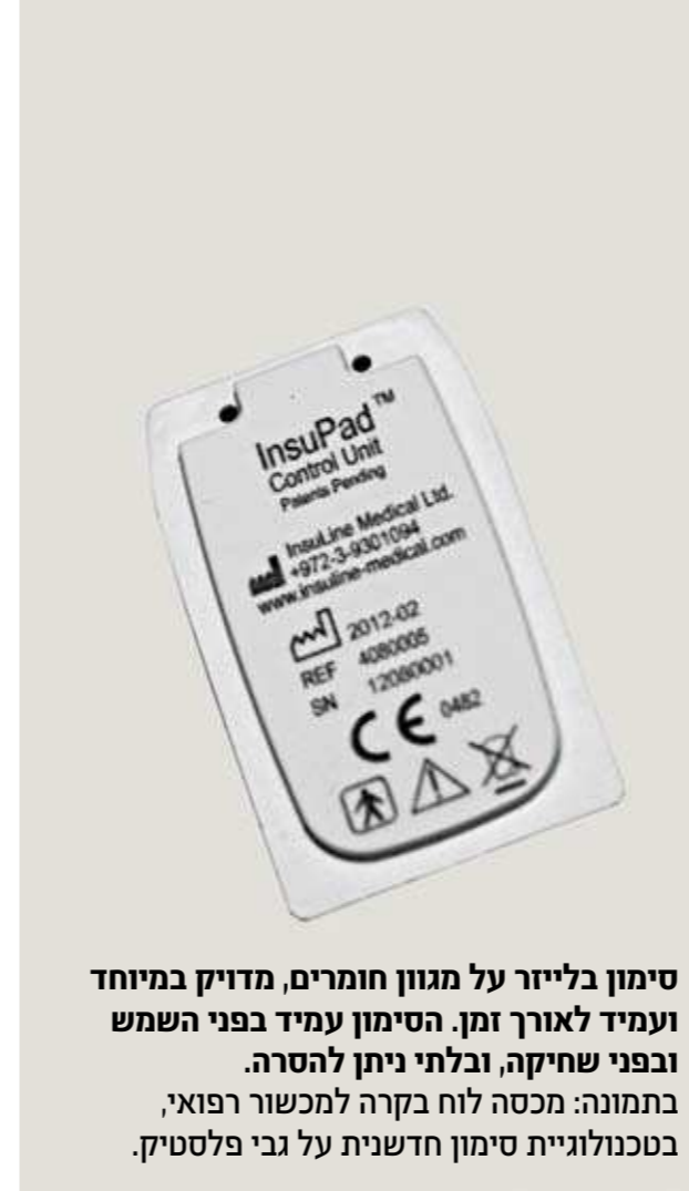
סימון בלייזר על מגוון חומרים, מדויק במיוחד ועמיד לאורך זמן. הסימון עמיד בפני השמש ובפני שחיקה, ובלתי ניתן להסרה. בתמונה: מכסה לוח בקרה למכשור רפואי, בטכנולוגיית סימון חדשנית על גבי פלסטיק.